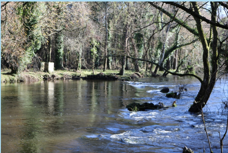
Río Ladra. Coas augas altas os muros dos caneiros quedan mergullados.

O terceiro tramo deste percorrido entre a área de lecer de Baamonde e o linde co concello de Guitiriz faise levando o río á dereita, despois de cruzalo pola ponte da estrada de Baamonde a Vilariño, e pódese alongar, e nós así o recomendamos (é cousa de un quilómetro máis ou menos), para darlle remate na ponte medieval e na capela gótica do San Alberte, visitar estes monumentos e achegarnos á fonte milagreira do santo contada e cantada por Manuel María.