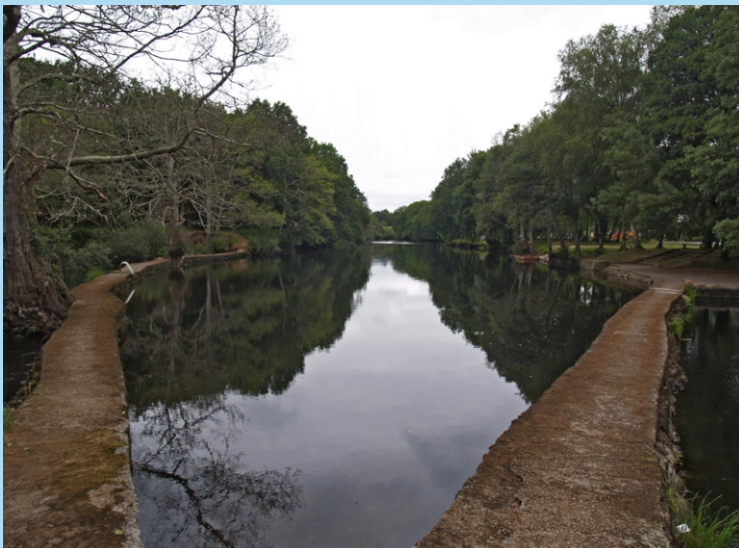
Caneiro e área de lecer de Begonte

Os caneiros son construcións para reter e desviar a auga dos ríos, xeralmente para conducila a un muíño. Nesta zona abundan tamén os caneiros para pescar cos muros en forma de V ( guiares ) que conducen a auga cara as bocas e pías , nas que se arman as redes. Algúns completáanse con casetos nos que se deposita a pesca e se refuxian os pescadores. Un dos peixes que máis se pescaban era a anguía, que cos encoros case desapareceu.