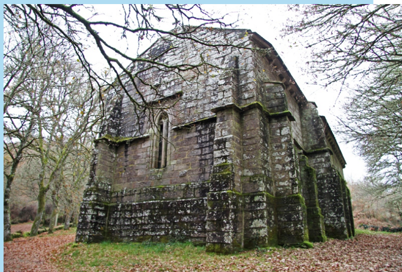
San Alberte de Parga. Na parroquia de Sambreiro (Guitiriz). A fachada principal é do século XIII.