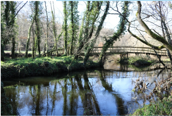
Un tramo na ruta pola beira do río Parga.