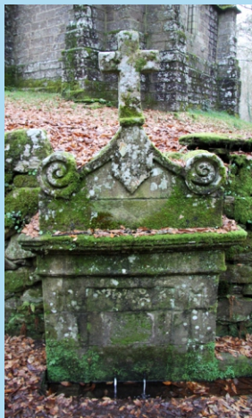
Fonte de San Alberte. Segundo a tradición a súa auga cura problemas da fala.