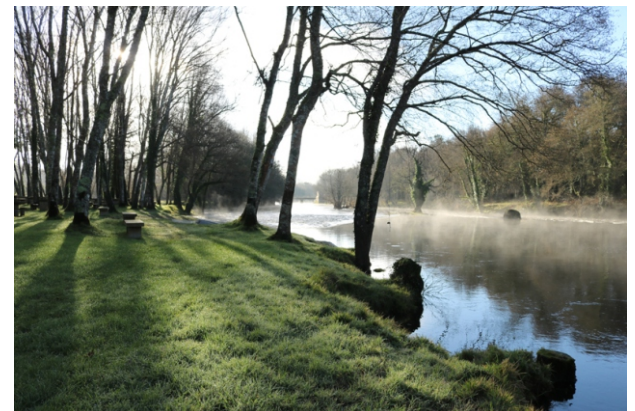
O Ladra na área de lecer de Begonte.