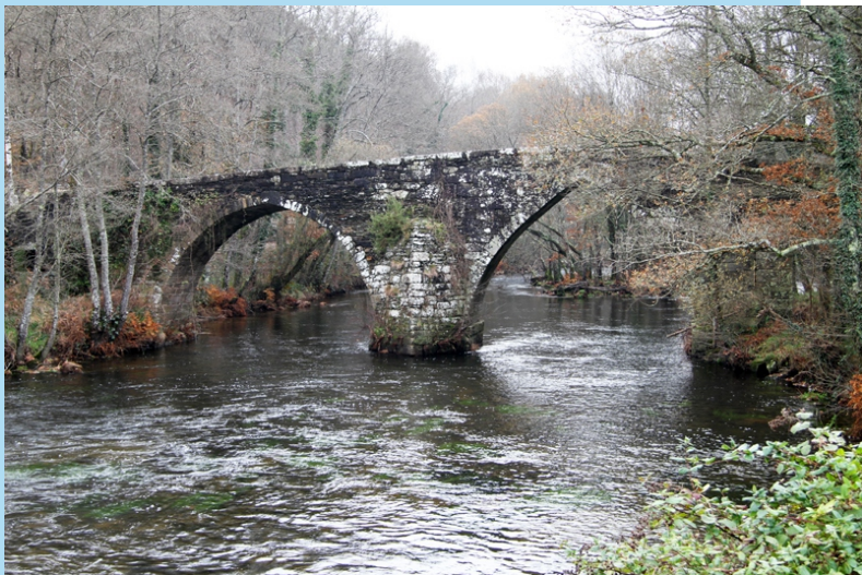
Ponte medieval de San Alberte sobre o río Parga.