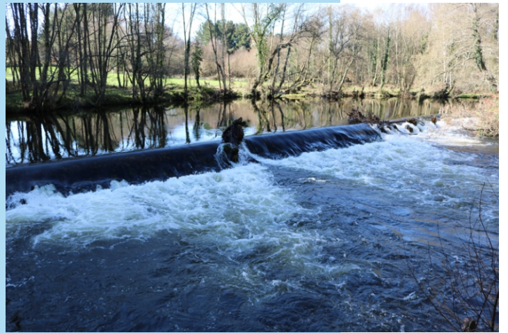
Caneiro en Baamonde