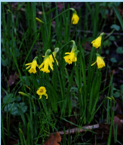
Narciso ( Narciso pseudonarcisus subs nobilis , moi abundante nas beiras do río ao longo de boa parte da ruta.