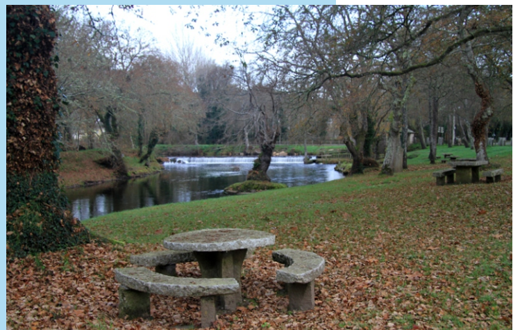
Área de lecer de Baamonde